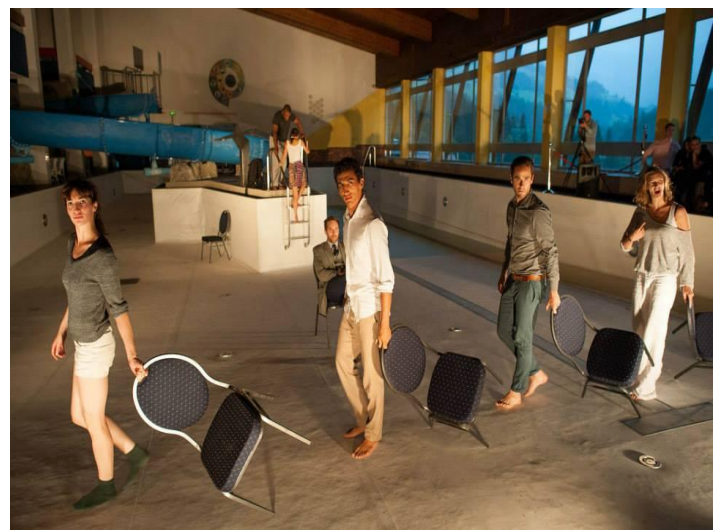
Na Forumu 2013. sudionici su imali priliku okušati se u glumi i glumiti u predstavama u organizaciji londonske Royal Akademije