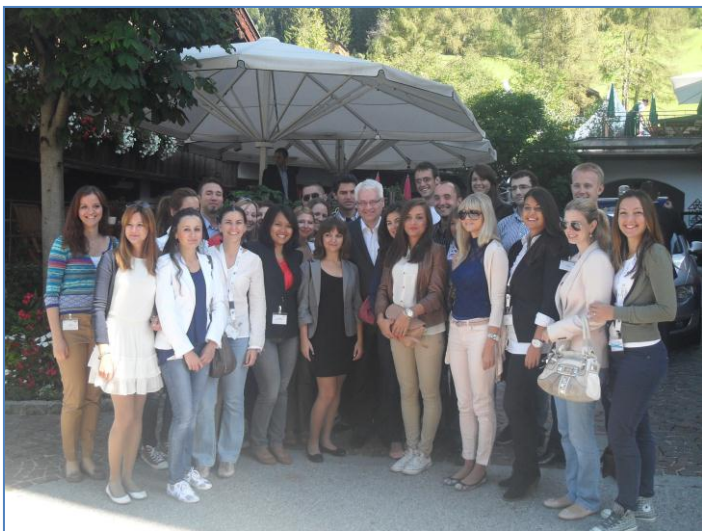
EFA 2012: dio hrvatskih stipendista zajedno s predsjednikom Republike Hrvatske prof. dr. sc. Ivom Josipovićem