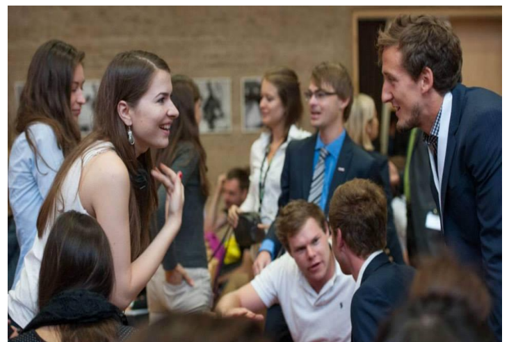
Osim razmjene znanja i iskustva brojne simulacije i interaktivne sesije omogućuju sudionicima kvalitetan networking koji može biti ključan za budući profesionalni rad