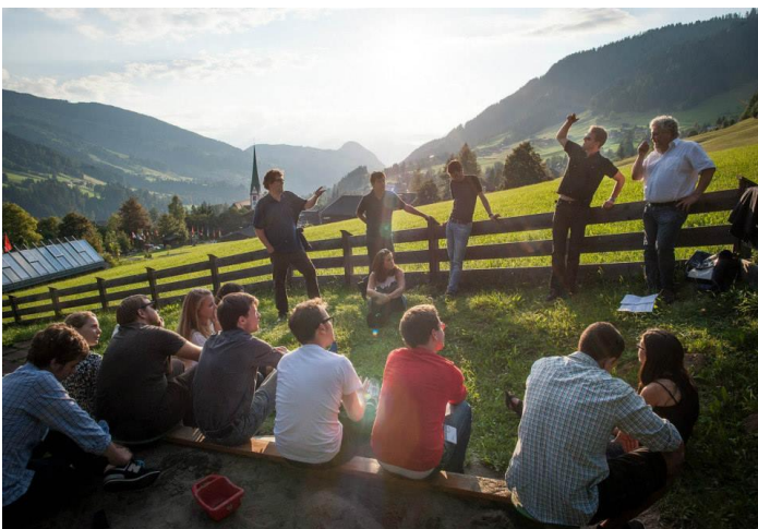
Neki seminari odvijaju se i u prirodi