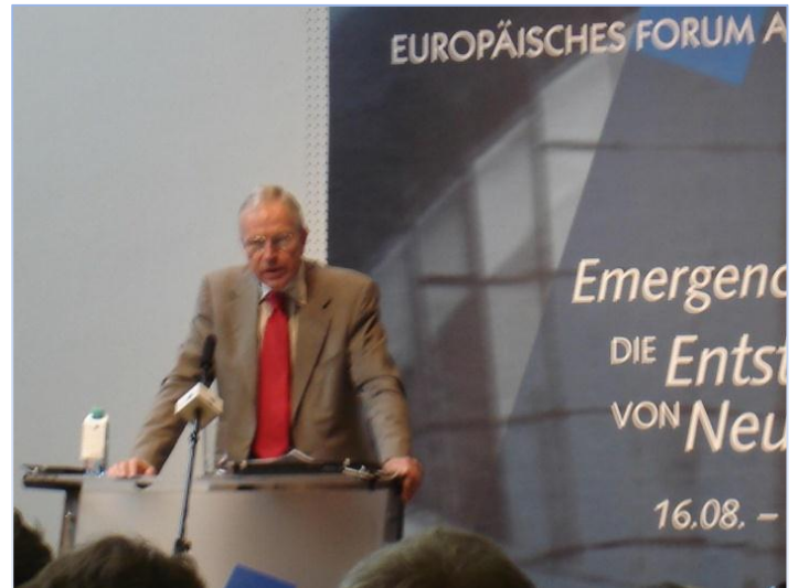
Izlaganje James M. Buchanana, dobitnika Nobelove nagrade za političku ekonomiju