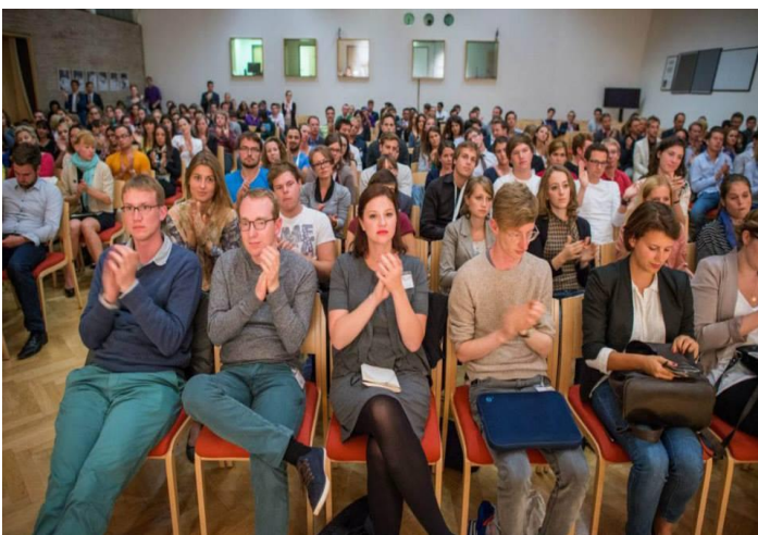
Multidisciplinarni simpoziji nude široki spektar predavanja, panel diskusija i gostovanje svjetskih stručnjaka iz raznih područja