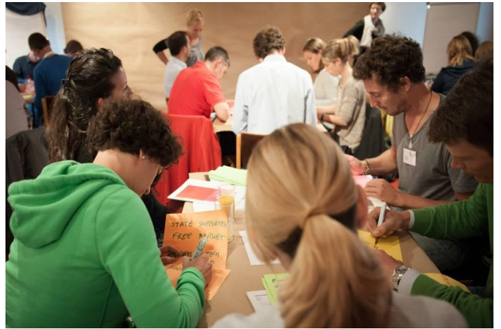
Inovativni formati radionica s kojima se sudionici imaju prilike susresti po prvi put