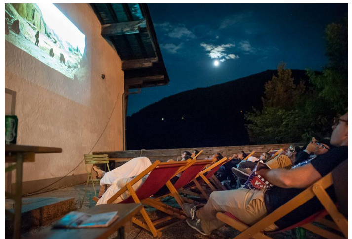
Tijekom dva i pol tjedna održavaju se razne projekcije filmova, dokumentarnih i igranih, od kojih su neke na otvorenom