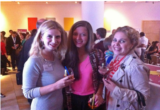
Osim predavanja, stipendisti imaju raznoliku ponudu poput Career loungea ili tematskih domjenaka