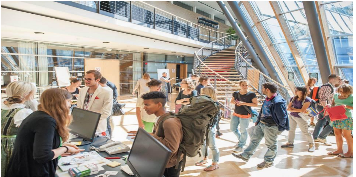
Konferencijski kompleks Europskog Foruma Alpbach - Congress Centre Alpbach