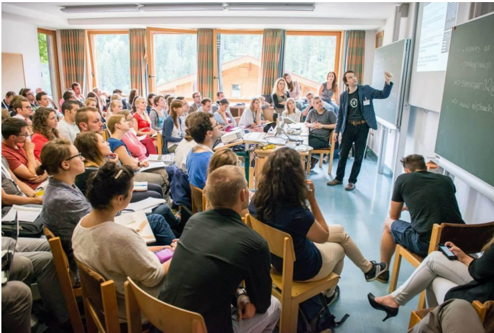
Seminari se održavaju u konferencijskim salama, ali i u školama, dvoranama, lobijima hotela