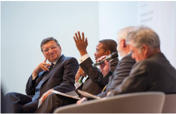
Jose Manuel Barroso, predsjednik Europske komisije