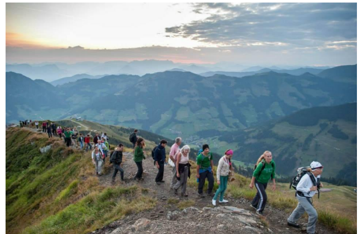
Sportske aktivnosti: planinarenje, odbojka, nogomet, tenis i dr.