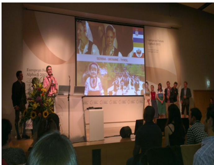
„International Evening“ - nakon Austrije, Hrvatska je 2011. s 36 sudionika imala najveći broj predstavnika u odnosu na ostale države